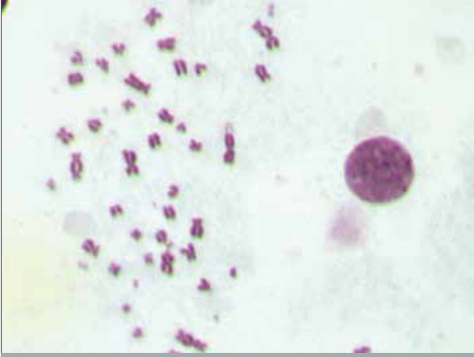
Resim 1. Radyasyonun etkilerinin belirlenmesinde en önemli gösterge kabul edilen disentriklerin analizi için metafaz plaklarının değerlendirilmesi